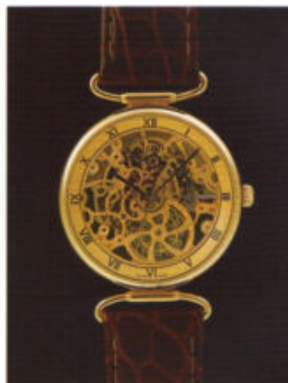
Modell 7007 mit automatischem Aufzug.

Skelettierung eines Uhrwerkes heißt auch: Beschränken auf das Wesentliche.