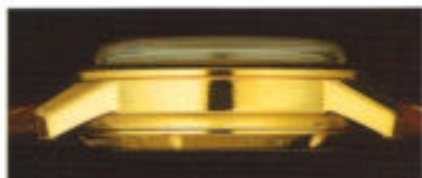
Eine Besonderheit: Das hochgewölbte Glas aus kratzfestem Saphirkristall.