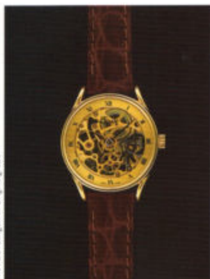
Modell 7003 mit Handaufzug.