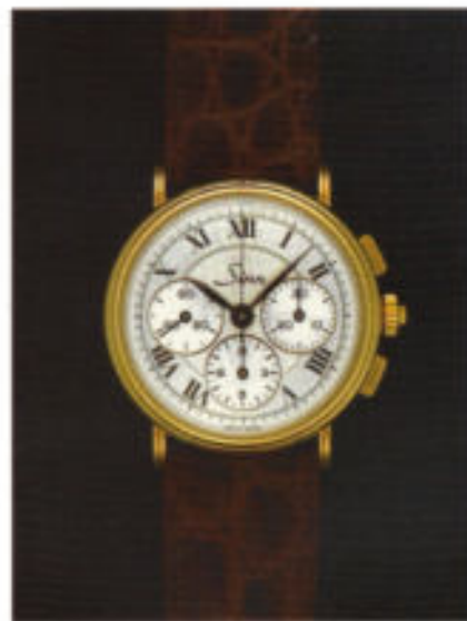
Modell 6009 Pl.

Mit dem bewährten Valjoux-Uhrwerk 7751 in einem Sterlingsilber-Gehäuse, bietet diese Uhr mit ihrem tiefblauen Zifferblatt gewünschten Kontrast. Durch die beiden gehärteten Mineralgläser erkennt man die Zeitanzeige und die filigrane Mechanik des fein gefinishierten Uhrwerkes.