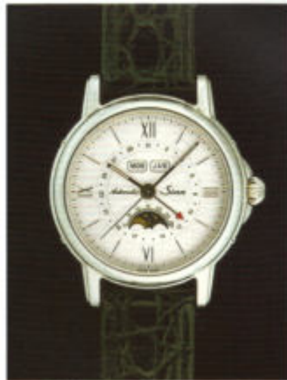
Modell 7008 in Edelstahl mit automatischem Aufzug.

Wetten, daß auch in dieser präzisen Uhr alles rund läuft!