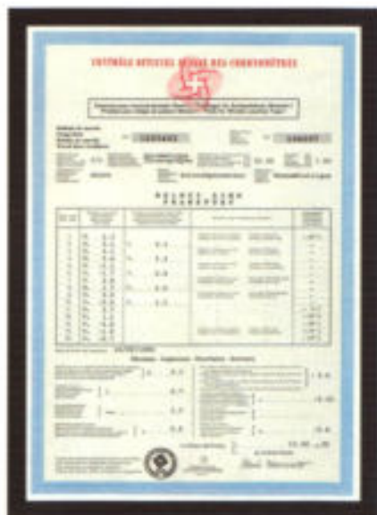
Eine serienmäßig mitgelieferte Selbstverständlichkeit: Das offizielle Chronometerzeugnis.

Sie können mit diesem hochwertigen Automatik-Chronographen die höchste Ganggenauigkeit erleben, die wir anzubieten haben. Ein Krokodilllederband, selbstverständlich mit Artenschutz-zertifikat, hält mit einer 22-KT-Goldschnelle dieses äußerst wertige Stück Luxus an Ihrem Arm. Wir bieten Ihnen mit dieser Uhr überlegene, souveräne Einzigartigkeit.