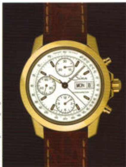
Der Goldchronograph Modell 2200 in edelstahlhartem 22 KT-Gehäuse.