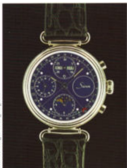
Modell 6002 in Sterlingsilber.

Mit dem bewährten Valjoux-Uhrwerk 7751 in einem Sterlingsilber-Gehäuse, bietet diese Uhr mit ihrem tiefblauen Zifferblatt gewünschten Kontrast. Durch die beiden gehärteten Mineralgläser erkennt man die Zeitanzeige und die filigrane Mechanik des fein gefinishierten Uhrwerkes.