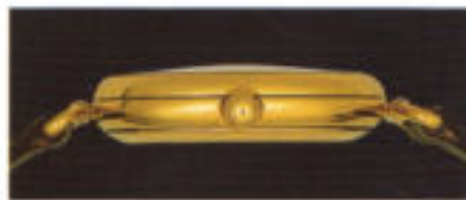
Die Luxusausführung aus einem anderen Blickwinkel.

Verlangen Schmuckstücke überhaupt die Zeitbestimmung?