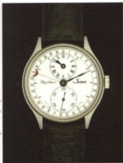
Der Regulator, Modell 6020 St, in Edelstahl mit Lederarmband.