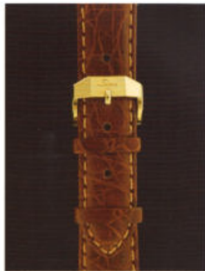
Die Dornschnelle, ein Detail aus 22 KT Gold. Das Krokodilllederband mit Artenschutz-zertifikat.