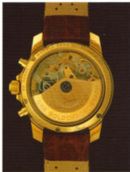
Lupenreines Finish des Uhrwerks mit 21 KT-Goldrotor.