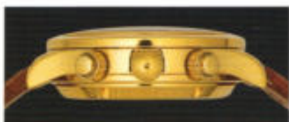
Konkrete Technik mit verschraubbaren Drückern und Krone.

»Technisches Schmückstück« – die Verbalisierung dieses Chronographen. Ein Gehäuse aus hochlegiertem Edelstahl, zwei Gläser aus kratzfestem Saphirkristall, verschraubbare Krone und Drücker, dazu eine tauchfähige Druckfestigkeit bis 200 m (20 bar) zeugen von Sinn-gemäßer Technik.