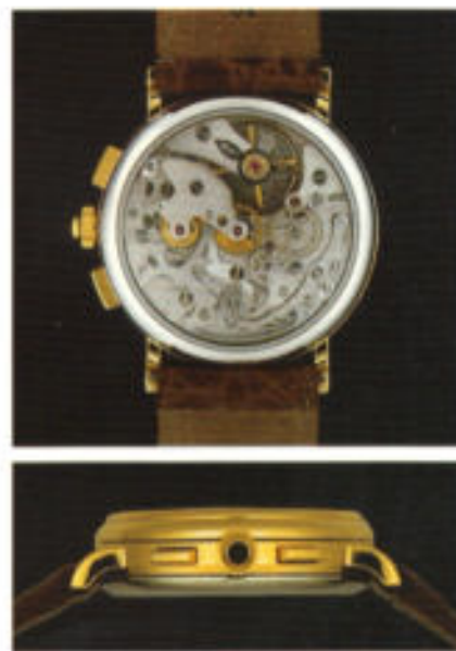
Von dem Lemania-Handaufzugswerk 1873 bleibt nichts verborgen.

Große Abbildung: Modell 6002 in Stahl, mit tiefblauem Zifferblatt.