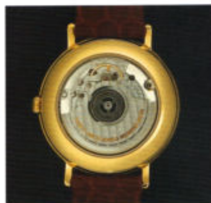
Die Rückansicht durch gehärtetes Mineralglas auf ein fein gearbeitetes Uhrwerk.

Unaufdringlich, ungewöhnlich und einfach schön. Das Sinn-Modell 7001 wird nur in Gold angeboten. Eine Uhr für den Kenner, der zugleich Zurückhaltung in der Formgebung liebt.