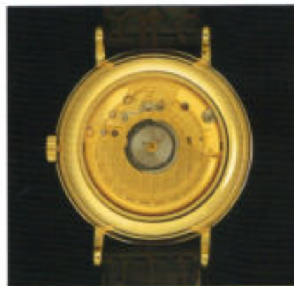
Modell 6025 mit vergoldeten Werkteilen.