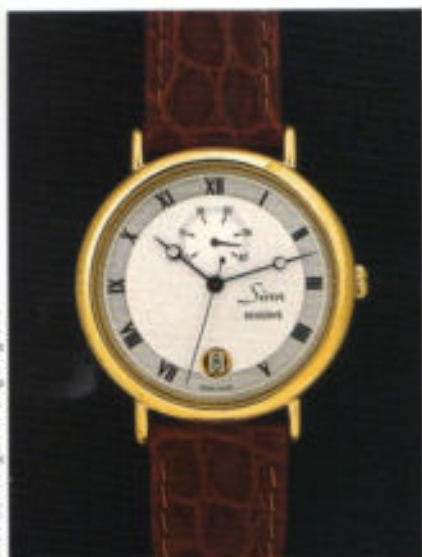
Modell 6023 mit Gangreserve-Anzeige.