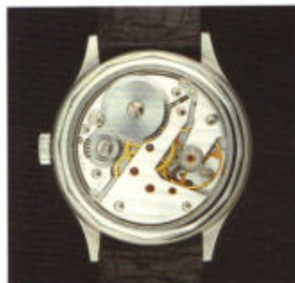
Der letzte Schliff am Uhrwerk durch ein Bodenglas sichtbar gemacht.