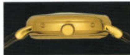
In der Seitenansicht durch die integrierten Korrektoren zur Verstellung von Wochentag, Tag und Mondphase unterschieden: Modell 6025.