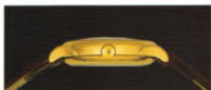
Ein Schmuckstück von der Seite gesehen.

Skelettierung eines Uhrwerkes heißt auch: Beschränken auf das Wesentliche.