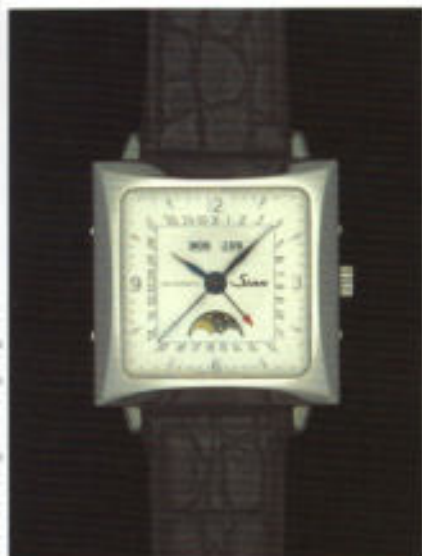
Modell 7009 in Edelstahl.