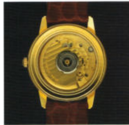
Innere Werte: das Werkfinish.