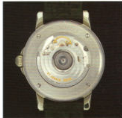
Beidseitig gehärtete Mineralgläser erlauben jeden Einblick.