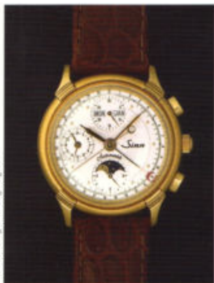
Modell 6015 PI in Edelstahl mit 20 µm Goldauflage.