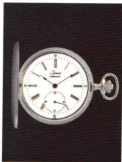
Sirin Modell 1996. Die Jubiläumsuhr aus Sterlingsilber (925/1000).