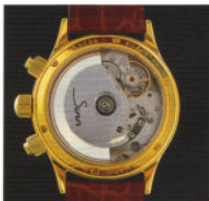
Der Hauch von Luxus auch in Form des Werk-Finish (Valjoux 7751).