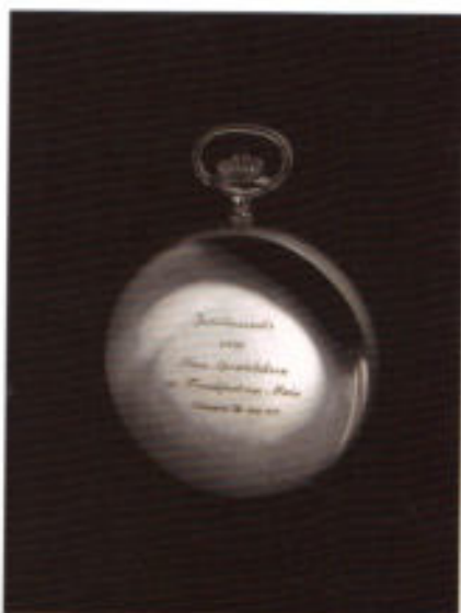
Diese Jubiläumstaschenuhr ist auf 100 Stück limitiert und mit exklusiver Handgravur gezeichnet.