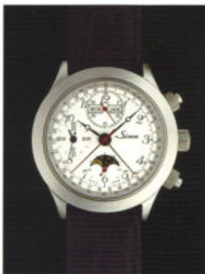
Modell 6026 St in Edelstahl.