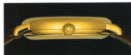
Die elegante Seitenansicht von Modell 6023.