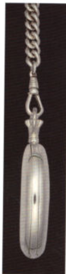
Die Silhouette der geschlossenen Taschenuhr, in Originalgröße.

Wir liefern diese Taschenuhr mit massiver Sterlingsilber-Kette in einer Kassette aus edlem Buchenholz.