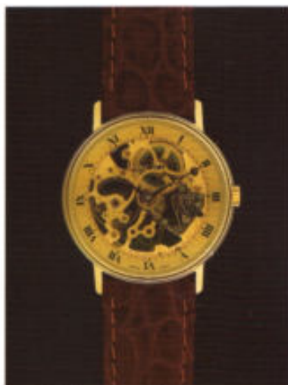
Modell 7004 mit Handaufzug.