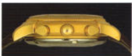
Die Rück- und Seitenansicht des Modells 6015 belegt den Anspruch auf Klassik.

Einfach nur Klassik! Nur Klassik? Immerhin zeigt Ihnen dieser Chronograph die Zeitentsprechung in Sekunden, Minuten, Stunden, Wochentagen, Datum und Monaten. Dazu läßt er Sie Mondphase und mittels 24-Stunden-Anzeige auch die Tagphase erkennen. Die Chronographenausstattung bietet Kurz- und Additionszeiten bis zu 12 Stunden sekundengenau an.