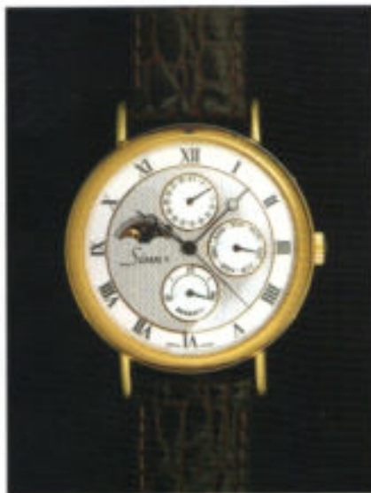
Modell 6025 Plaque oder 18 KT Gold, mit Gangreserve- und Mondphasen-Anzeige.