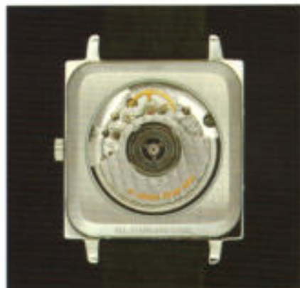
Blick auf das Basis-Werk ETA 2892-A2.

Harmonie als Gesetzmäßigkeit fester Verhältnisse, in der Teile eines Kunstwerkes zueinander stehen müssen, um als schön zu gelten – bei unserem Klassiker Modell 7008 wurde sie in unübersehbarer, wie auch unaufdringlicher Weise realisiert.