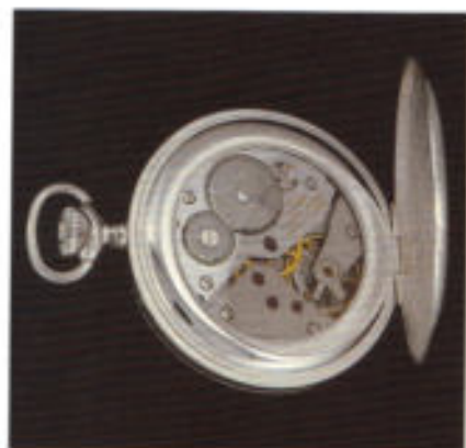
Das Taschenuhrwerk Unitas 6498 in sauberem Finish.

Das 35-jährige Firmenjubiläum bietet einen willkommenen Anlaß, unser Sortiment wieder um den Taschenuhrenbereich zu erweitern. Mit einem exklusiven Auftakt: unserer Jubiläums-Taschenuhr mit Meistergravur, in feinsten Ausführung, die unseren Anspruch an eine mechanische Uhr deutlich macht. Unser Jubiläums-Modell 1996.