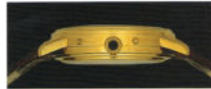
Die Seitenansicht von Modell 7001.