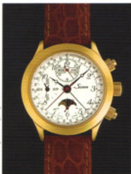
Modell 6026 PI mit 40 µm (1) Goldauflage.