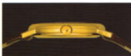
Die filigrane Eleganz.

Präzisionsliebhaber begeistern sich an der Sichtbarkeit feinsten Uhrenmechanik, Liebhaber ergänzen mit einer Skelettuhr ihre bereits vollständige Uhrensammlung, Statiker runzeln die Stirn, Graveure verwirklichen sich an ihr und Uhrmacher widmen ihr überdurchschnittlich viel Zeit und Liebe.