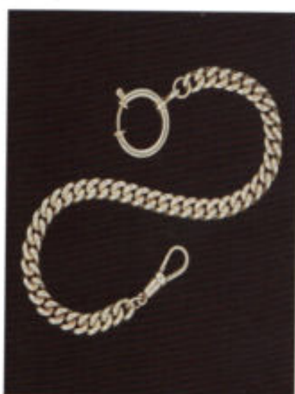
Die solide Kette aus Sterlingsilber.