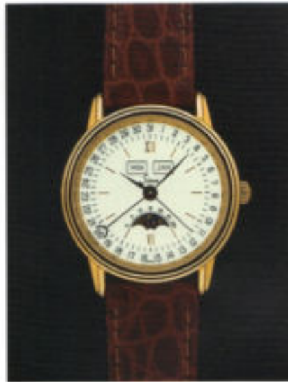
Modell 7001 in 18 KT Gold.

Mit Verzicht auf überflüssige Schnörkel bietet dieses klassische Meisterwerk zeitlose Formschönheit. Die vom Federhaus gespeicherte Energie wird als Gangreserve in Stunden angezeigt.