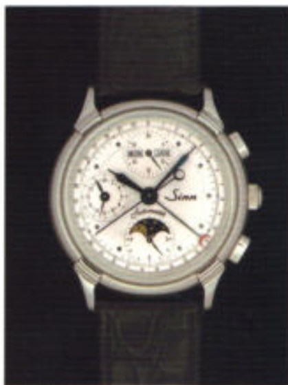
Modell 6015 St in Edelstahl.