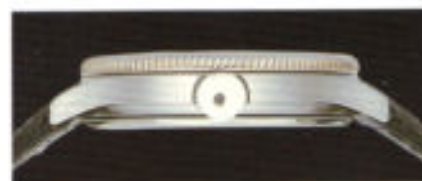
Diese Uhr trägt nicht dick auf.

Kaum 100 Jahre ist es her, da wurde die deutsche Zeit – gerade hatte man sich auf nur eine einzige geeinigt – von solchen Zifferblättern abgelesen. Meist eingemauert, liefen diese Regulatoren mit Sekundenpendel im Jahr sekundengenau – eine im Zeitalter der Atomuhr fast unglaubliche mechanische Leistung.