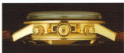
Verschraubbare Krone und geschützte Drücker, Details aus 22 KT Gold.

In der Technik perfekt, in der Präzision überlegen, folgt dieser Goldchronograph dem Grundsatz guten Geschmacks: »Von allem das Beste«. 22-karätiges Gold, edelstahlhart, paart sich mit feingeschliffenem Saphirkristall und umschließt ein Uhrwerk, dessen feine Endbearbeitung kein Werkteil ausgelassen hat und dessen Präzision mit dem C.O.S.C.-Chronometerprüfzeugnis serienmäßig dokumentiert ist.