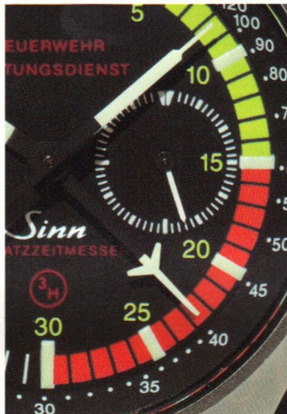
23 Minuten sind vergangen – höchste Zeit für den Befehl zum Rückzug.