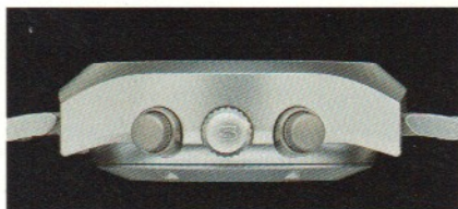
Modell EZM 4 ACHILLES: Stahlschraubboden und das Profil der Uhr mit geschützten Drückern und verschraubbarer Krone.

Auch das neueste Modell unter unseren Einsatz-Zeitmessern hat wieder ein spezifisches, professionelles Nutzer-Profil. Auf den ersten Blick erkennbar ist auch hier die linksseitige Platzierung von Krone und Drückern zwecks optimaler Bedienbarkeit; eine Anordnung, die sich bei den Einsätzen von Maritimen Einheiten der GSG 9 und Spezialeinheiten von Polizei und BGS bewährt hat. Die Anforderung: perfekte Funktionalität unter extremen Bedingungen – was im Falle der Feuerwehren und Retter vor allem leichte und schnelle Ablesbarkeit bedeutet.