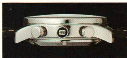
Das entspiegelte Saphirkristallglas gestattet den Blick auf das fein veredelte Uhrwerk.

Präzise und unverwundlich funktionierende Mechanik in zeitlos gültiger ästhetischer Gestaltung – ein gemeinsamer Nenner, der die Liebhaber klassischer Automobile mit den Freunden edler Uhren eint. Mit unserer neuen Modellreihe 956 haben wir einen hoch funktionalen, robusten Chronographen entwickelt, dessen Erscheinungsbild stilsicher an die Optik klassischer Automobil-Armaturen erinnert.