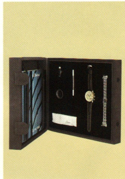
Der Jubiläums-Chronograph zum 100-jährigen Bestehen der Gummiwerke FULDA wird nur im Komplettset ausgeliefert.