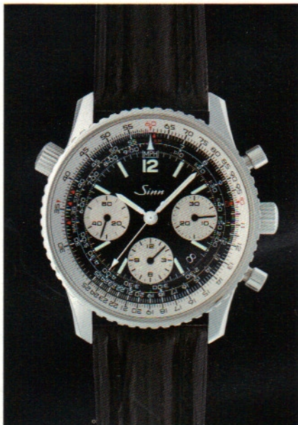
Modell 903 St Aut mit 12-Stunden-Zifferblatt und schwarzem Lederarmband.