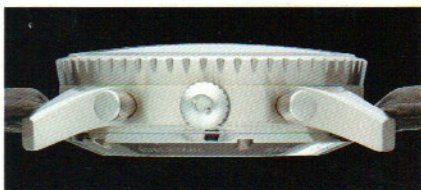
Innen entspiegeltes Saphirkristallglas läßt auf die inneren Werte der Uhr blicken. Auch von der Seite gesehen: ein Schmuckstück.

Etwas sehr Gutes noch besser zu machen – ein charakteristischer Sinn-Anspruch, den wir mit dem neuen Modell 903 St Aut wieder einmal sehr ernst genommen haben. Diese komplexe Variante unseres klassischen Navigationschronographen 903 bietet versierten Uhrenfreunden eine ganze Reihe faszinierender Leistungsmerkmale. Mit dem bewährten Automatik-Valjoux 7750-Werk bleibt die 903 St Aut dauerhaft und verlässlich in Gang, mit einer Zeitreserve von bis zu 48 Stunden. Um dem edlen, sportlichen Erscheinungsbild der beliebten 903 mit Handaufzug zu entsprechen, haben wir die Minuten- und Stundenzeiger sowie die kleine Sekunde – abweichend vom klassischen Valjoux-Aufbau – versetzt bei 3, 6 und 9 Uhr angeordnet. Die neu hinzugekommene Datumsanzeige platzierten wir bei 4 Uhr 30. Mit über 30 Arbeitsgängen ist das Zifferblatt der 903 St Aut eines der aufwendigsten aller Sinn-Uhren. Damit das Schwarz seine kontrastreiche Farbechtheit behält, wird es in einem galvanischen Verfahren als Schwarznickel-Schicht aufgetragen. Ziffern und Indizes werden anschließend mit Diamanthobeln eingegräst und dann mit dem Edelmetall Rhodium galvanisiert. Für den ungetrübten Blick auf das feinmechanische Meisterwerk mit Perlschliff-Finish, fein gebläuten Schrauben und Genfer Streifen auf dem Rotor statten wir beide Seiten der Uhr mit